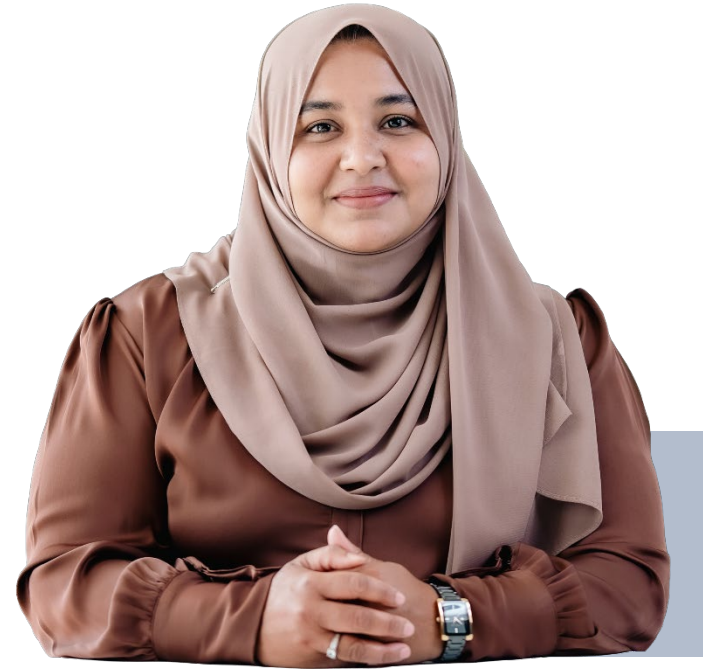
پیش از این در خدمت شما مکاتبات

این سند به منظور اعلام نتایج امتحان پایان نامه دانشجویان در رشته مدیریت بازرگانی، در تاریخ ۲۸ شهریور ۱۴۰۴ صادر گردید. این سند به منظور اعلام نتایج امتحان پایان نامه دانشجویان در رشته مدیریت بازرگانی، در تاریخ ۲۸ شهریور ۱۴۰۴ صادر گردید. این سند به منظور اعلام نتایج امتحان پایان نامه دانشجویان در رشته مدیریت بازرگانی، در تاریخ ۲۸ شهریور ۱۴۰۴ صادر گردید.